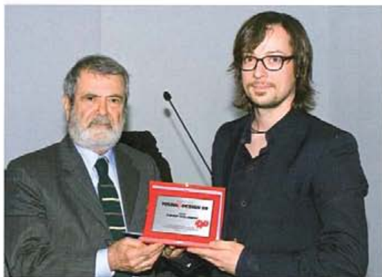
Premio Rima Editrice Il Design dello Stupore